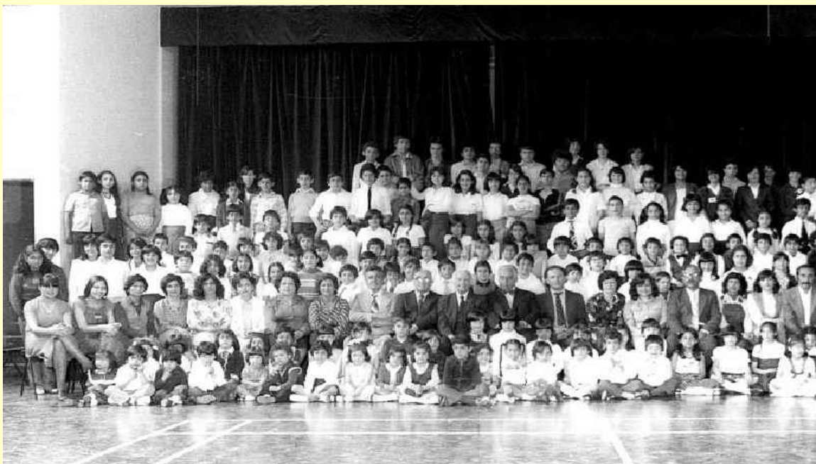
The K. Tahta Armenian Community Sunday School (Circa 1979-1980).

K Tahta Armenian Community Sunday School